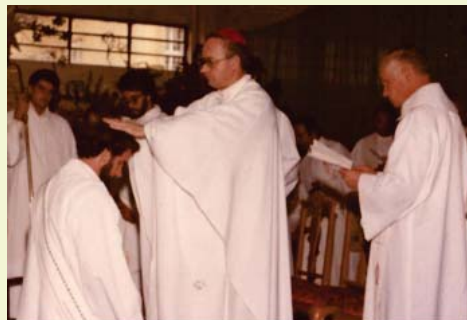
27 DE DEZEMBRO DE 1980 GRAMADO - RS

Com a participação de dezenas de pessoas, nas missas do 1º de janeiro de 2021 (8h30, 11h30, e 18h) foram celebradas o Dia da Santa Maria, Mãe de Jesus e nossa Mãe, e o Dia Mundial da Paz. Na homilia, Pe. Mario Pizetta explicou como se chegou à comemoração do dia mundial da paz, e disse: "A paz será possível quando tivermos um mundo mais justo." E continuou: "cada um de nós torna-se responsável para criar esta consciência." Cada horário de missa contou com uma equipe para leituras e cantos.