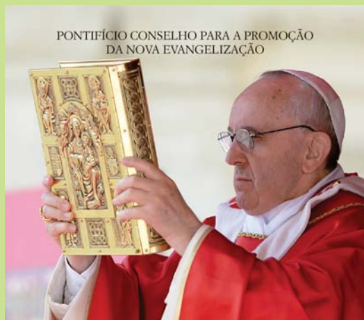
PONTIFÍCIO CONSELHO PARA A PROMOÇÃO DA NOVA EVANGELIZAÇÃO